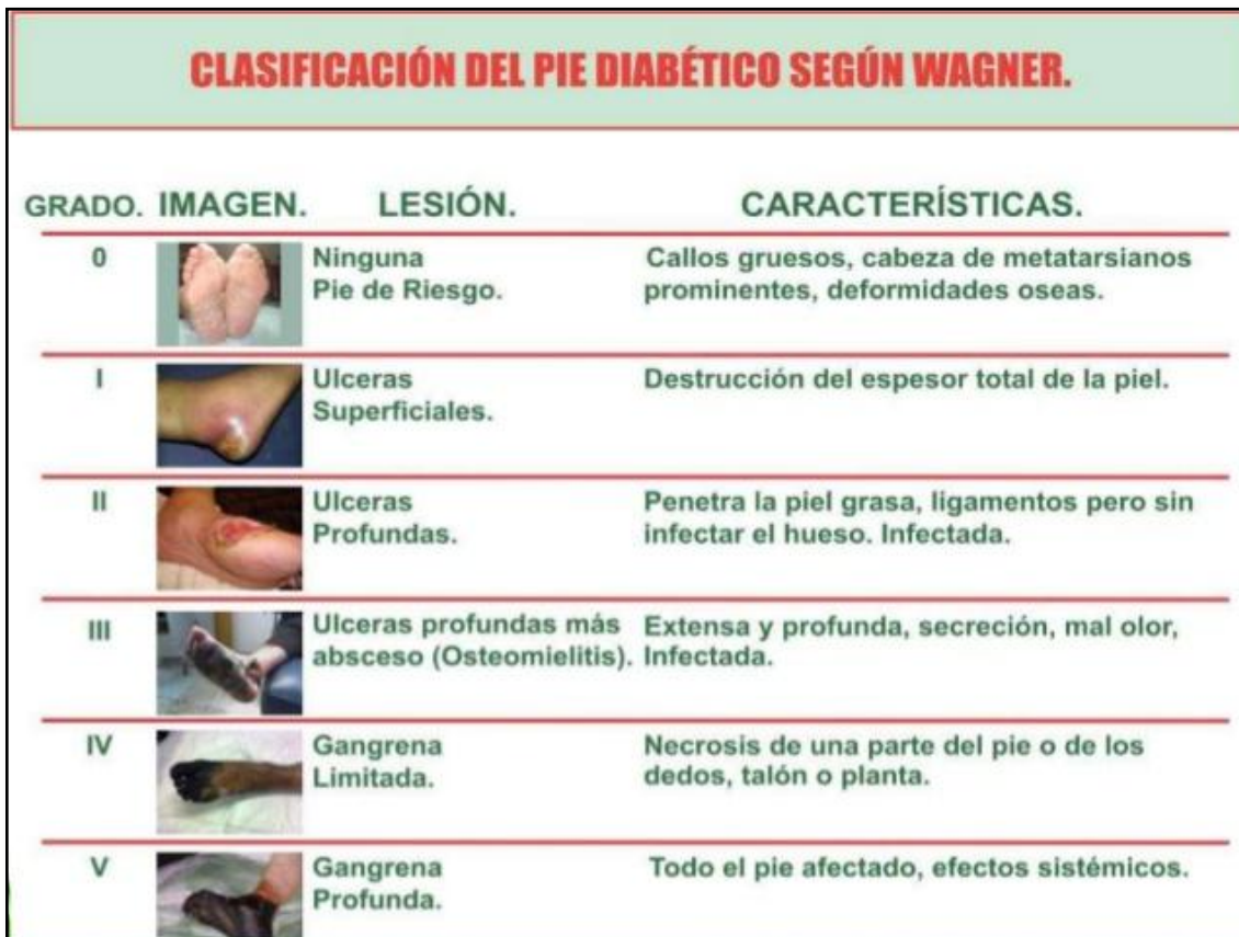
Figura 5. Clasificación de del pie diabético según Wagner.